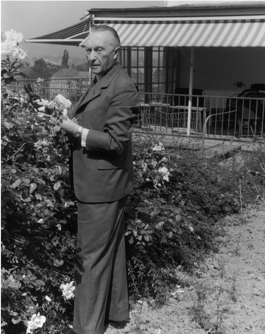
Bundeskanzler Konrad Adenauer 1949 im Garten seines Hauses.

tannien waren hier die Wohneigentumsquoten bereits Anfang des 20. Jahrhunderts so außergewöhnlich hoch, dass ein Großteil der Wahlbevölkerung häufig bereits Hauseigentum besaß und dieses als typische Wohnform verstand. Darüber hinaus machte es die Konkurrenz im Zweiparteiensystem den liberalen Parteien wie den US-Demokraten schwer, im Kampf um Wählerstimmen die Hauseigentümer zu vernachlässigen. Je größer die Parteien sind, desto eher müssen