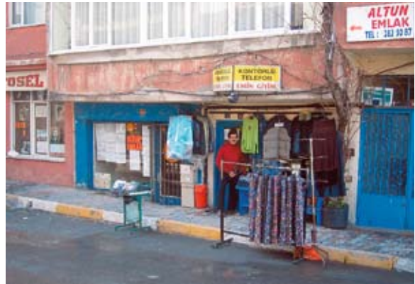
Laden mit Kleidungs- und Telefonkartenverkauf in Istanbul. Diese Art von Einzelhandel ist in vielen Ländern noch sehr verbreitet.

Gesellschaftliche Gruppen definieren ihre eigenen Stilrichtungen. Als Folge davon entwickelt eine Modehandelskette nicht mehr nur eine, sondern mehrere Kollektionen, die sie unter verschiedenen Labels in den eigenen Filialen verkaufen und auf diese Weise mehr Käufer erreichen kann.