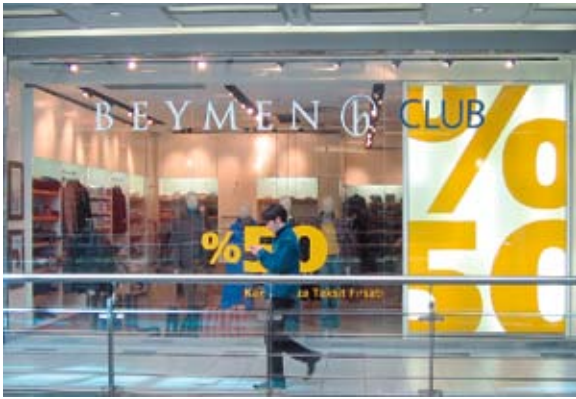
Filiale einer Modehandelskette in einem neugebauten Einkaufszentrum in Istanbul. Markennamen werden immer wichtiger in der Modeindustrie.